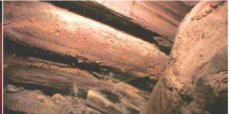
■ 整個木結構以粗壯樹幹搭建而成，建築手法古老。