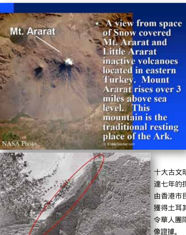
Mt. Ararat A view from space of Snow covered Mt. Ararat and Little Ararat inactive volcanoes located in eastern Turkey. Mount Ararat rises over 3 miles above sea level. This mountain is the traditional resting place of the Ark.