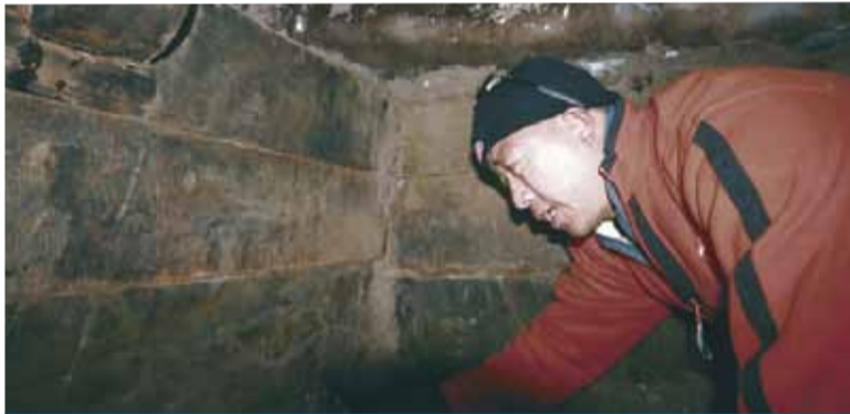
■ 探索隊展示圖像和影片顯示木結構深埋在火山石及冰層之下。