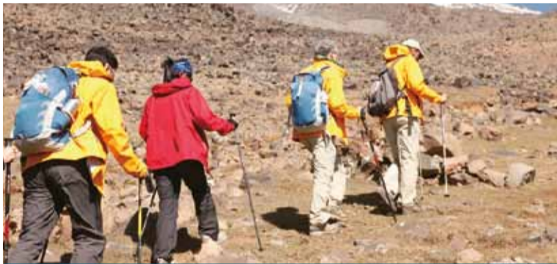
■ 探索隊堅持信念理想永不放棄，終於跨越所有障礙成功得到重大發現，有家長相信這種精神能夠激勵下一代。

不過要實現以上種種又談何容易，現在只不過是開了個頭。而相關發現的科學考證已在過去一年開始。越來越多科學家表示支持發現就是挪亞方舟的說法，並希望未來陸續有更多震撼性發現能公諸於世。